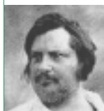
Honoré de Balzac 1799-1850

Ensuite et surtout -et ce point est avéré- sur ces contes dels Balssas, plane l'ombre d'un des plus grands écrivains français: dans Balssa, Balzac n'est pas loin.