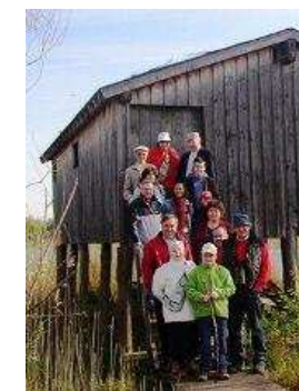
A la cèrca de campairòls