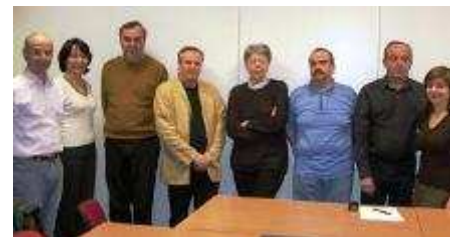
Fête des Frontaliers