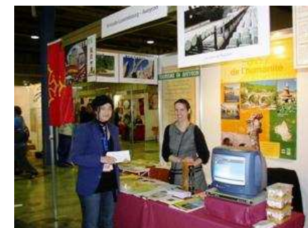
Une journée à Remerschen